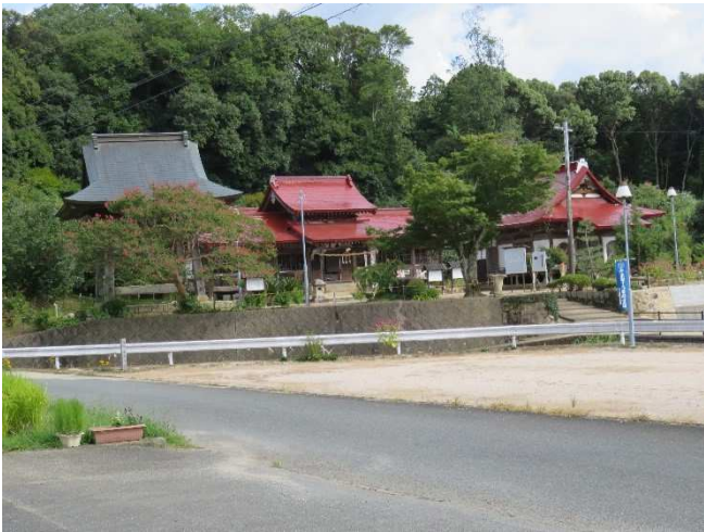
現在の興隆寺全景