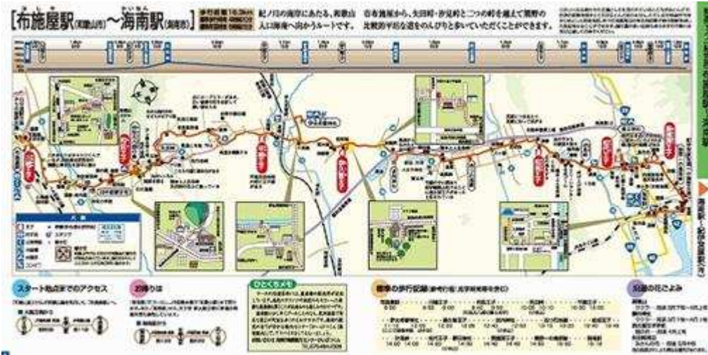
資料 資料は和歌山観光情報 熊野古道 紀伊路の街道マップ