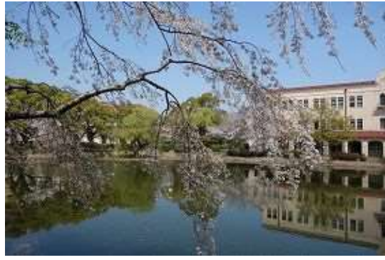
飛鳥から藤原京 67期 田辺勇次