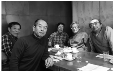
5名での開催となった懇親会

毎年のように行っているのが、今年も幹事である私の不精のせいでこの時期での開催となってしまいました。メンバーも大体固定化しているのですが、今回は母が母上逝去に伴う喪が明けていないので欠席と